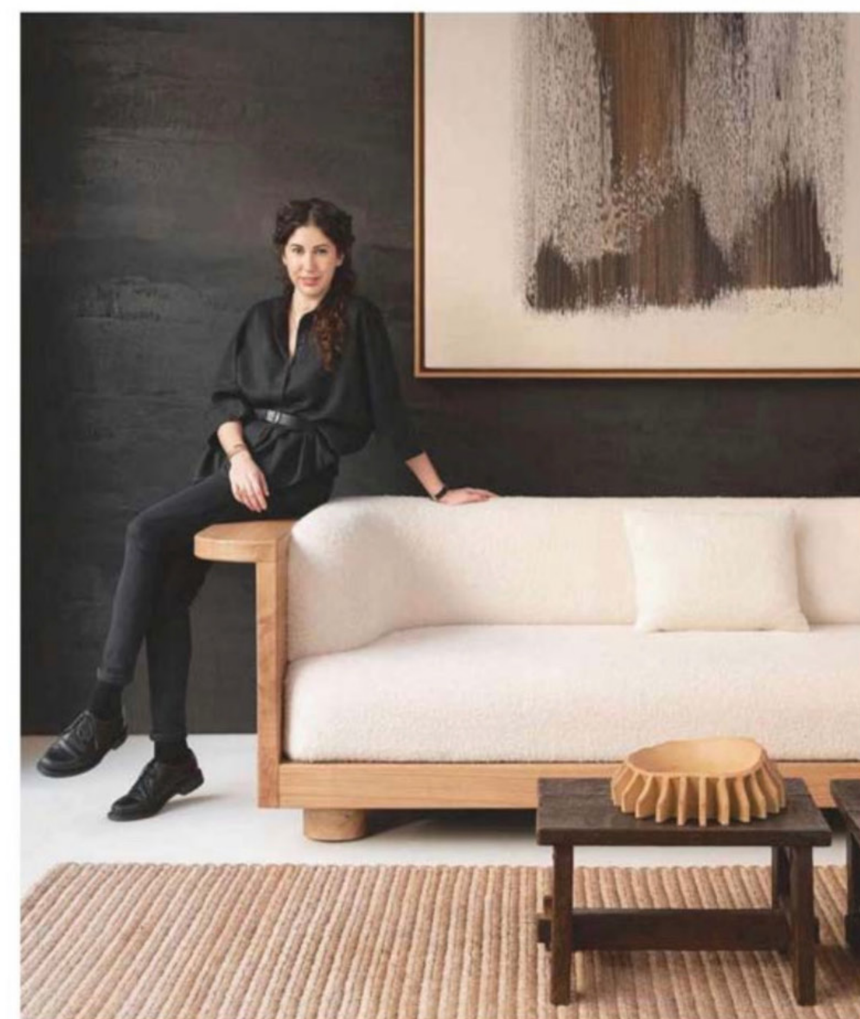
Deux en un Nouvel usage pour le canapé : le modèle "A001", associant une structure en chêne massif brossé et une assise tout en rondeur en laine (Pierre Frey), est entouré d'une tablette pour poser livres ou objets. En exclusivité à la galerie JAG, à Paris.