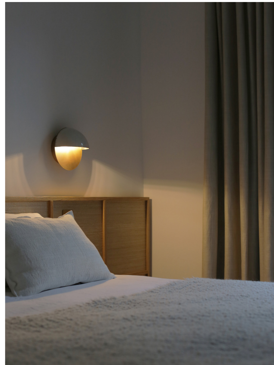
RAKU-YAKI - DEMI-LUNE